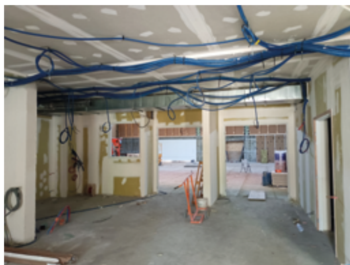
Le Hall d'entrée