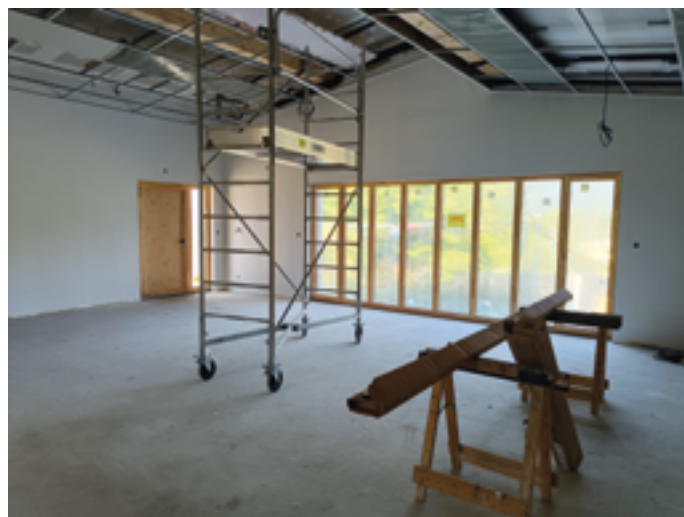
Le futur Dojo

La Municipalité vous tiendra régulièrement informés de l'évolution du chantier.