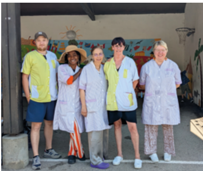
AGENTS DU PÉRISCOLAIRE