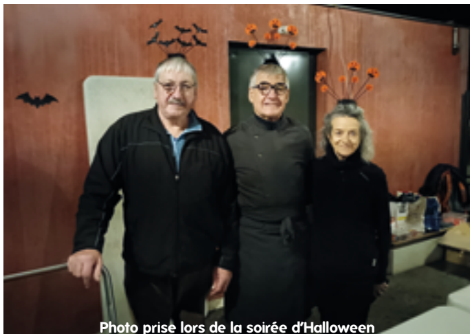
Photo prise lors de la soirée d'Halloween